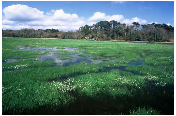
Les prés salés à marée haute