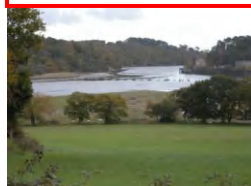
Le « Pont Brûlé »

Les sentiers sont aménagés sur domaines public et privé. Respectons la nature et les aménagements, les propriétés privées (clôtures...) et les activités agricoles (animaux...).