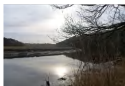
L'estuaire du Scorff en hiver