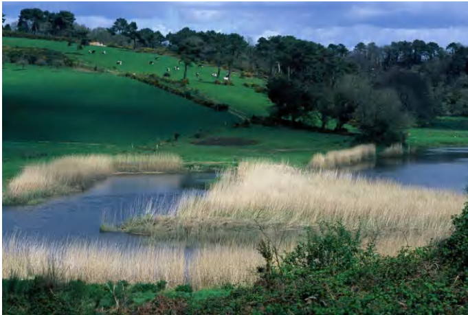
Roselière du Scave

Vous verrez aussi, outre l'ancienne voie de chemin de fer, son patrimoine historique marqué par les bombardements de la guerre 1939-1945, le pont brûlé et les anciennes poudrières du Mentec, la chapelle de Notre Dame de Bon Secours, ancien lieu de pèlerinage des marins de la rade de Lorient, l'église Saint-Pierre Saint-Paul, conservant notamment les statues de la chapelle de la Trinité, elle aussi détruite durant la guerre.