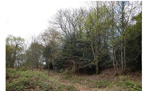
Pays Touristique Vannes-Lanvaux