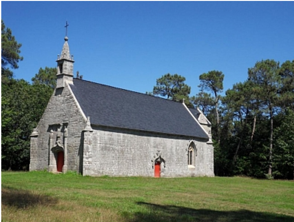
Pays Touristique Vannes-Lanvaux

La chapelle St Michel est entourée d'un cadre de verdure sur une colline, à 125 m d'altitude, d'où la vue s'étend jusqu'au Golfe du Morbihan. Sur cet ancien site d'occupation romaine, la chapelle est achevée en 1524 selon la volonté du recteur de Saint-Avé, Pierre de Chohan. Ce sanctuaire est dédié à l'archange Saint-Michel comme la plupart des sites construits en hauteur pour que la distance de la terre au ciel se trouve réduite et la fonction des anges messagers facilitée. L'aspect extérieur est très simple : une construction en bel appareil de granite de forme rectangulaire, un petit clocheton en pierre, deux baies. La sacristie a été accolée au XIXème siècle. Le décor du portail ouest présente des motifs Renaissance : l'anse de panier est surmonté d'une accolade et encadré de colonnes engagées soutenant des statues de saints personnages. Au-dessus, une corniche alterne des motifs d'angelots et de coquilles. La chapelle est inscrite comme Monuments Historiques.