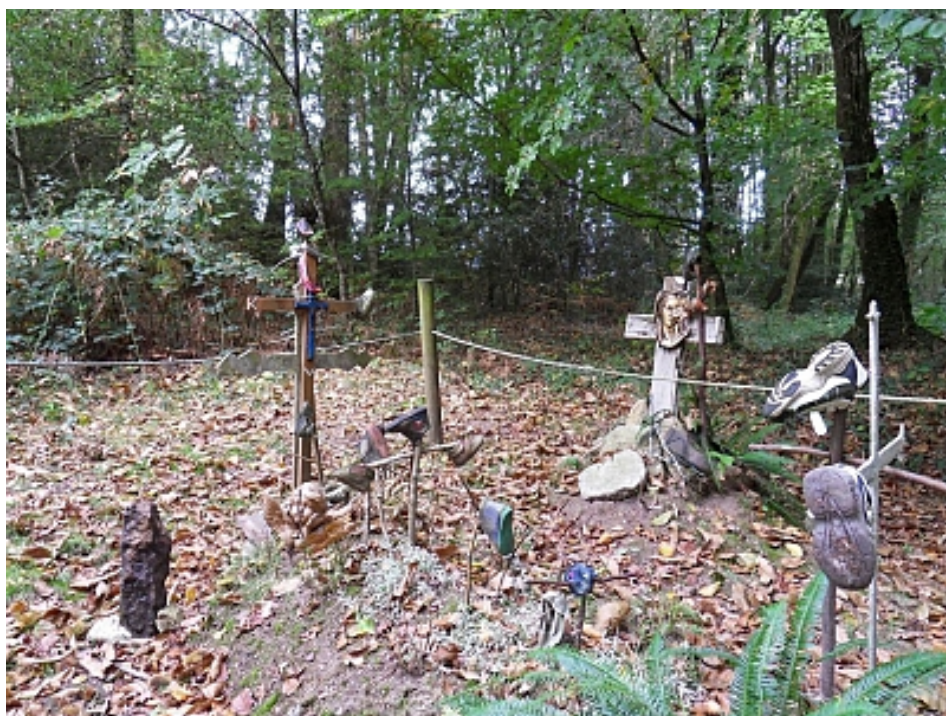
Pays Touristique Vannes-Lanvaux

Au milieu de la forêt près du chemin, une tombe étrange est couverte de croix et de chaussures d'enfants et d'adultes. En voici la légende : Un soir d'automne, le recteur de Brandivy traversait la forêt de Lanvaux. Il venait de porter les derniers sacrements au village des Granges et se hâtait pour rentrer avant la nuit. Soudain, il est attaqué par deux hommes armés d'un couteau. Le recteur s'empresse d'avalier l'hostie. Mais un coup lui tranche la tête qui rebondit, dit-on, 7 fois. Il fut enterré à l'endroit même de sa mort. On raconte que sept trous apparurent dans l'herbe là où sa tête a rebondi. Depuis cette époque, les parents ou personnes ayant des problèmes de mobilité viennent déposer un objet pour obtenir la guérison.