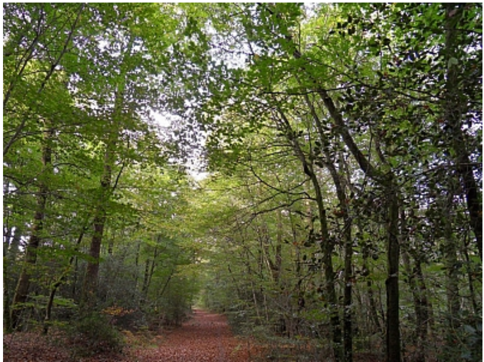
Pays Touristique Vannes-Lanvaux

La forêt de Lanvaux est une belle forêt de feuillus gérée par l'Office National des Forêts. Sillonnée de grandes allées forestières, elle offre de nombreux circuits de petite randonnée (circuit de l'étang de la Forêt) et de grandes randonnées (GR 38 et Equibreiz).