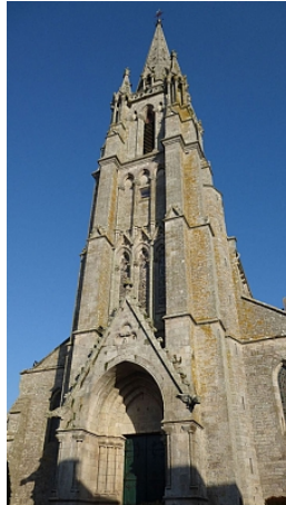
Pays Touristique Vannes-Lanvaux