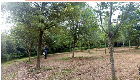
Pays de Vannes