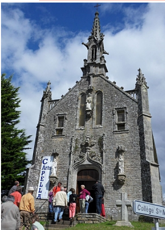
Pays Touristique Vannes-Lanvaux