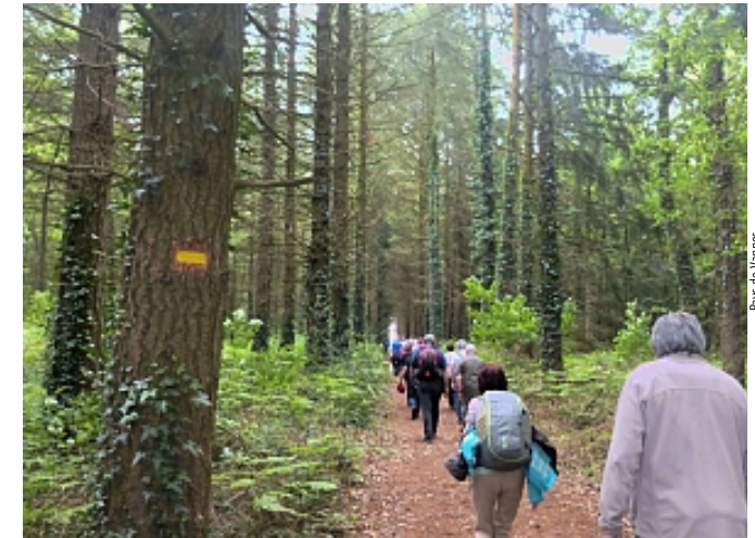
Pays de Vannes