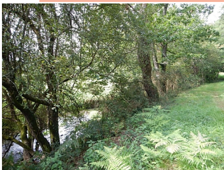
Pays Touristique Vannes-Lanvaux