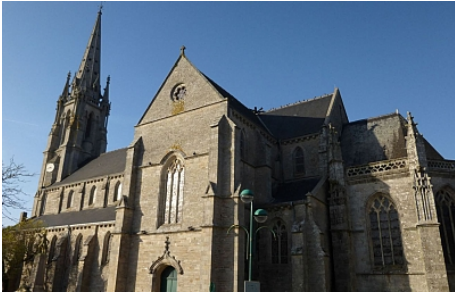
Pays Touristique Vannes-Lanvaux

Château, Eglise &amp; Abbaye, Patrimoine religieux