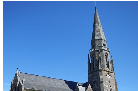
Pays Touristique Vannes-Lanvaux