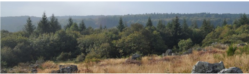
Vue depuis les Grées

www.rochefortentere-tourisme.bzh - 02 97 26 56 00