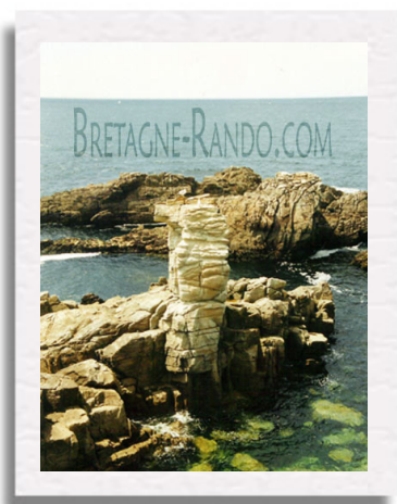
Beg en Aud, vue sur l'île de Groix et isthme de penthièvre

Arrêtons-nous près des ruines, qui servent d'observatoire, admirons alors l'Arche taillée dans la roche par les éléments et reposons-nous alors près d'elle à marée basse.