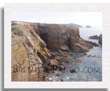
L'observatoire vu de Beg en Aud