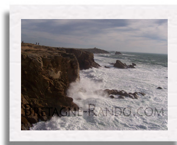
La pointe du Percho lieu dit l'observatoire